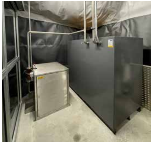
Le réservoir intermédiaire se situe à 3000 m d'altitude.