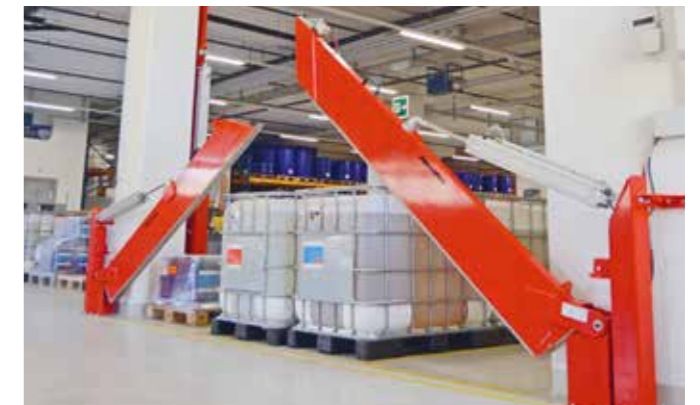
Fix montierte Löschwasserbarriere mit automatischer Entriegelung und Rückstellung